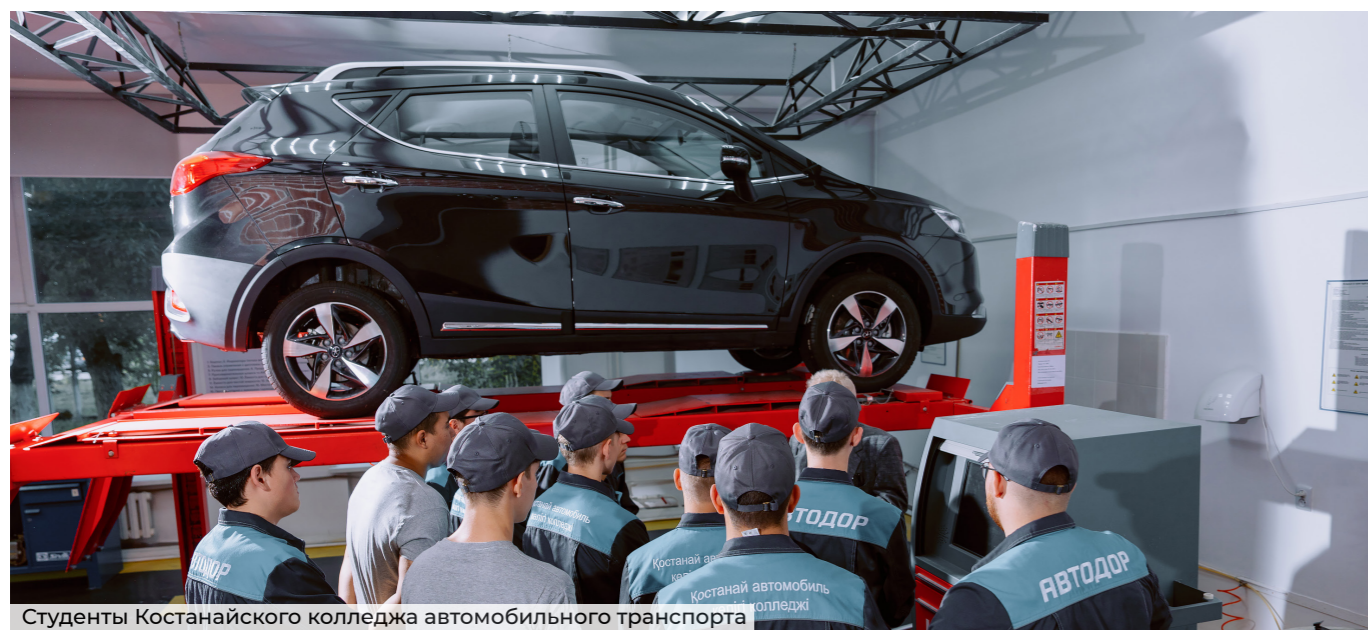
Студенты Костанайского колледжа автомобильного транспорта

Для нас важно, чтобы учебные заведения выпускали технических инженеров, готовых работать по современным информационным технологиям, но, к сожалению, нам приходилось уделять много времени переподготовке и